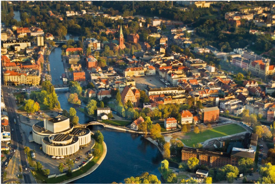
Fot. Marek Chełmiński