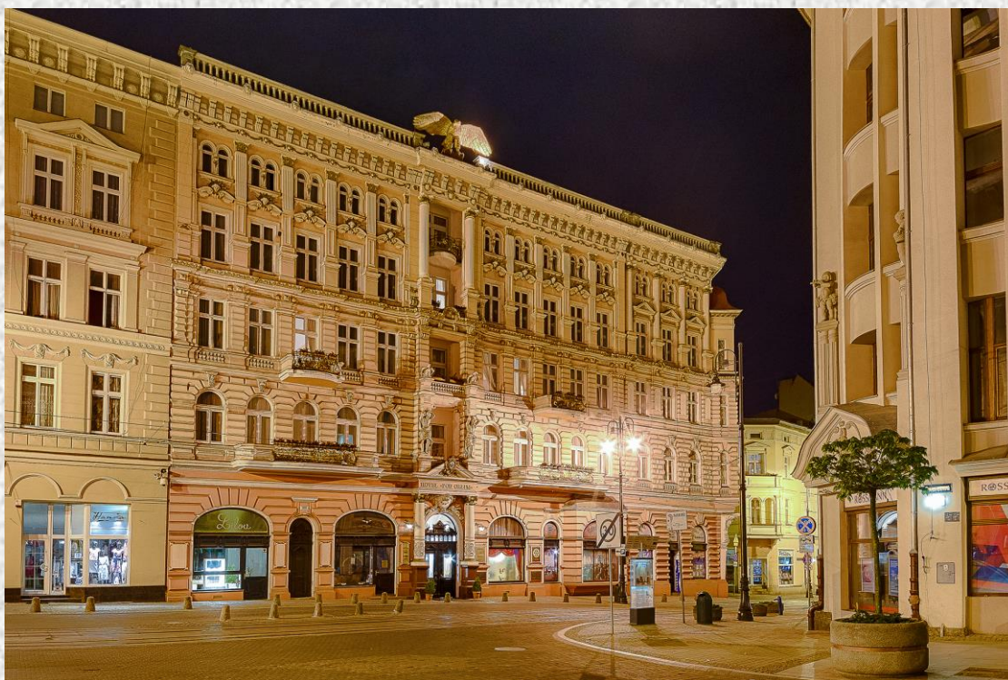
Hotel Focus Premium Pod Orłem