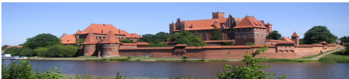
Zamek Krzyżacki w Malborku

Wszystkim uczestnikom Symposium proponujemy także uczestnictwo w spotkaniu towarzyskim z udziałem znanego bydgoskiego zespołu „Żuki”, a także wycieczkę krajoznawczą do Malborka oraz zwiedzanie Zamku Krzyżackiego